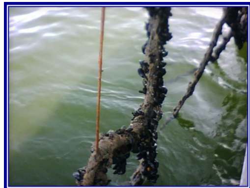
Filière de moules après le passage des canards

~ La direction et le personnel de la SODIM vous souhaitent un bel été!