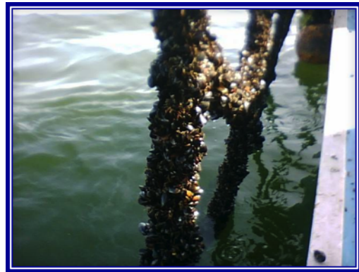
Filière de moules avant le passage des canards

L'industrie a sollicité le soutien du MAPAQ pour contrer partiellement ces impacts financiers.